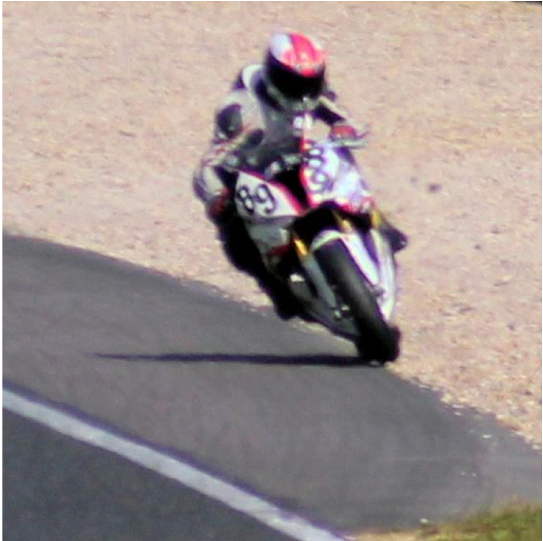
Grosse équerre dans le gravier et je coupe sur la terre